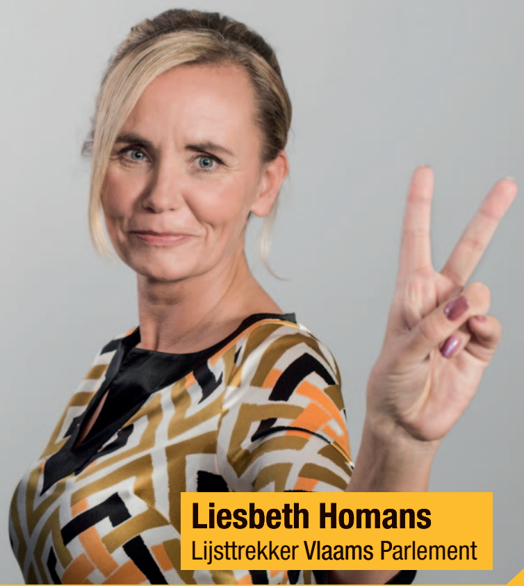
Liesbeth Homans Lijsttrekker Vlaams Parlement

Als burger, als vader en als burgervader zoek ik elke dag oplossingen voor en het welzijn van iedereen die werkt, spaart en onderneemt. Maar zolang we België niet hervormen, staan we machteloos tegenover de hoge belastingen, de faillissementengolf, de verkwistende structuren.