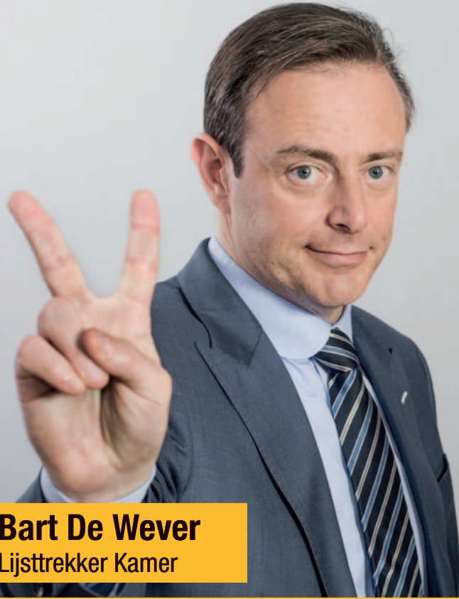
Bart De Wever Lijsttrekker Kamer